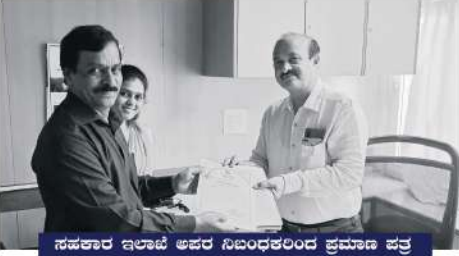
ಸಹಕಾರ ಇಲಾಖೆ ಅಪರ ನಿರ್ದೇಶಕರಿಂದ ಪ್ರಮಾಣ ಪತ್ರ ಸ್ವೀಕರಿಸುತ್ತಿರುವ ಮಾನ್ಯ ಅಧ್ಯಕ್ಷರು

ಭಾಗಗಳಲ್ಲಿ ನಿರ್ಮಾಣ ಮಾಡುವುದರೊಂದಿಗೆ ಶಿಕ್ಷಣ ಕ್ಷೇತ್ರದಲ್ಲಿ ಬಲವಾದ ಹೆಜ್ಜೆ ಇಟ್ಟು ಹೊಸ ಕ್ರಾಂತಿ ಮಾಡೋಣ, ನಮ್ಮ ಪ್ರತಿಭಾವಂತ ವಿದ್ಯಾರ್ಥಿಗಳ ಉಜ್ವಲ ಭವಿಷ್ಯಕ್ಕೆ ನಾನಿ ಹಾಡಬೇಕಾದ ಜವಾಬ್ದಾರಿ ನಮ್ಮದಲ್ಲವೇ?