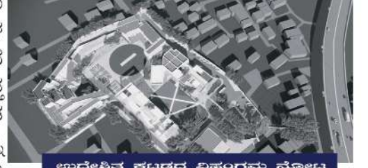
ಉದ್ದೇಶಿತ ಕಟ್ಟಡದ ಏರ್ಪಾಟು ನೋಟ

ಶಿಕ್ಷಣಕ್ಕೆ ಹಿಂದೆಗಿಂತಲೂ ಇಂದು ಪ್ರಾಮುಖ್ಯತೆ ಹೆಚ್ಚಿದೆ. ಸೇವಾ ಕ್ಷೇತ್ರಕ್ಕೆ ಸೀಮಿತವಾಗಿದ್ದ ಶಿಕ್ಷಣ ಸಂಸ್ಥೆಗಳು ಇಂದು ವಾಣಿಜ್ಯ ಮಯವಾಗಿದೆ. ಘನ ಸರ್ಕಾರಗಳ ಮೀಸಲಾತಿ ನಿಯಮಗಳು ಮುಂದುವರೆದ ಸಮಾಜದ ವಿದ್ಯಾರ್ಥಿಗಳ ಭವಿಷ್ಯಕ್ಕೆ ಪೆಟ್ಟುಕೊಟ್ಟಿದೆ. ಇಂತಹ ಪರಿಸ್ಥಿತಿಯಲ್ಲಿ ಭವಿಷ್ಯದ ಪೀಳಿಗೆಗಳ ಶಿಕ್ಷಣದ ಸವಾಲುಗಳ ಬಗ್ಗೆ ಮುಂದಾಲೋಚನೆ ಮಾಡದೇ ಹೋದಲ್ಲಿ ನಮ್ಮ ಸಮಾಜದ ಪ್ರತಿಭಾವಂತ ಬಡ/ಮಧ್ಯಮ ಕುಟುಂಬದ ವಿದ್ಯಾರ್ಥಿಗಳ ಭವಿಷ್ಯ ಎತ್ತ ಸಾಗಬಹುದೆಂದು ಯೋಚಿಸಿದರೆ ಪರಿಸ್ಥಿತಿ ನಡುಕ ಹುಟ್ಟುತ್ತದೆ. ಈಗಾಗಲೇ ನಮ್ಮ ಸಮಾಜ ಬಹಳಷ್ಟು ತಡೆ ಮಾಡಿದೆ, ಆದರೂ ಸಮಯ ಮೀರಿಲ್ಲ ಕರ್ನಾಟಕ ಆರ್ಯವೈಶ್ಯ ಮಹಾಸಭೆಯ ನೇತೃತ್ವದಲ್ಲಿ ಶಿಕ್ಷಣ ಸಂಸ್ಥೆಗಳನ್ನು ಕಟ್ಟುತ್ತಾ ಉತ್ತಮವಾದ, ಅತ್ಯುತ್ತಮವಾದ ಅಂತರಾಷ್ಟ್ರೀಯ ಗುಣ ಮಟ್ಟದ ಶಿಕ್ಷಣ ಸಂಸ್ಥೆಗಳನ್ನು ರಾಜ್ಯದ ನಾನಾ