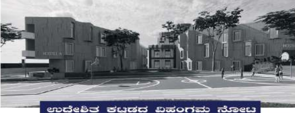
ಉದ್ದೇಶಿತ ಕಟ್ಟಡದ ಏರ್ಪಾಟು ನೋಟ

ವ್ಯಾಪಾರ, ವಾಣಿಜ್ಯೋದ್ಯಮಗಳ ಮೂಲಕ ಸಮಾಜದಲ್ಲಿ ತನ್ನ ಅಸ್ತಿತ್ವವನ್ನು ಉಳಿಸಿ ಬೆಳೆಸಿಕೊಂಡಿರುವ ಆರ್ಯವೈಶ್ಯ ಸಮಾಜ ದಾನ-ಧರ್ಮ-ಸೇವಾ ಕಾರ್ಯಕ್ರಮಗಳ ಮೂಲಕ ನಾಗರಿಕ ಸಮಾಜದಲ್ಲಿ ಇಂದಿಗೂ ತನ್ನ ಕೀರ್ತಿ ಪ್ರತಿಷ್ಠೆಗಳನ್ನು ಉಳಿಸಿಕೊಂಡು ಬಂದಿದೆ. ರಾಜ್ಯಾದ್ಯಂತ ದೇವಾಲಯಗಳು, ಕಲ್ಯಾಣ ಮಂದಿರಗಳಂತಹ ಯೋಜನೆಗಳಿಗೆ ಪ್ರಾಶಸ್ತ್ಯ ನೀಡಿದ ನಮ್ಮ ಹಿರಿಯರು, ಇತರ ಸಮಾಜದವರಂತೆ ಗುಣಮಟ್ಟದ ಹಾಗೂ ಉನ್ನತ ಶಿಕ್ಷಣ ಸಂಸ್ಥೆಗಳ ನಿರ್ಮಾಣಕ್ಕೆ ಪ್ರಾಶಸ್ತ್ಯ ನೀಡಲಿಲ್ಲ.