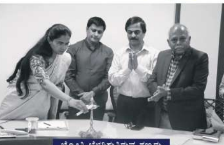
ಜ್ಯೋತಿ ಬೆಳಗಿಸುತ್ತಿರುವ ಗಣ್ಯರು

ಆರ್ಥಿಕವಾಗಿ ಹಿಂದುಳಿದ ಪ್ರತಿಭಾವಂತ ವಿದ್ಯಾರ್ಥಿಗಳಿಗೂ ಸಹ ಯು.ಪಿ.ಎಸ್.ಸಿ, ಐ.ಎ.ಎಸ್ ಪರೀಕ್ಷೆಗಳನ್ನು ಬರೆಯಲು ಅನುಕೂಲ ಮಾಡಿಕೊಡಲು ಉದಯಿಸಿದ ಸಂಸ್ಥೆಯೇ ವಾಸವಿ ಅಕಾಡಮಿ. ಈಗಾಗಲೇ 4 ತಂಡಗಳಿಗೆ ಉತ್ತಮ ಮಾರ್ಗದರ್ಶನ ನೀಡಿ ವಿದ್ಯಾರ್ಥಿಗಳ ಉಜ್ವಲ ಭವಿಷ್ಯಕ್ಕೆ ನಾಂದಿಯಾಗಿದೆ.